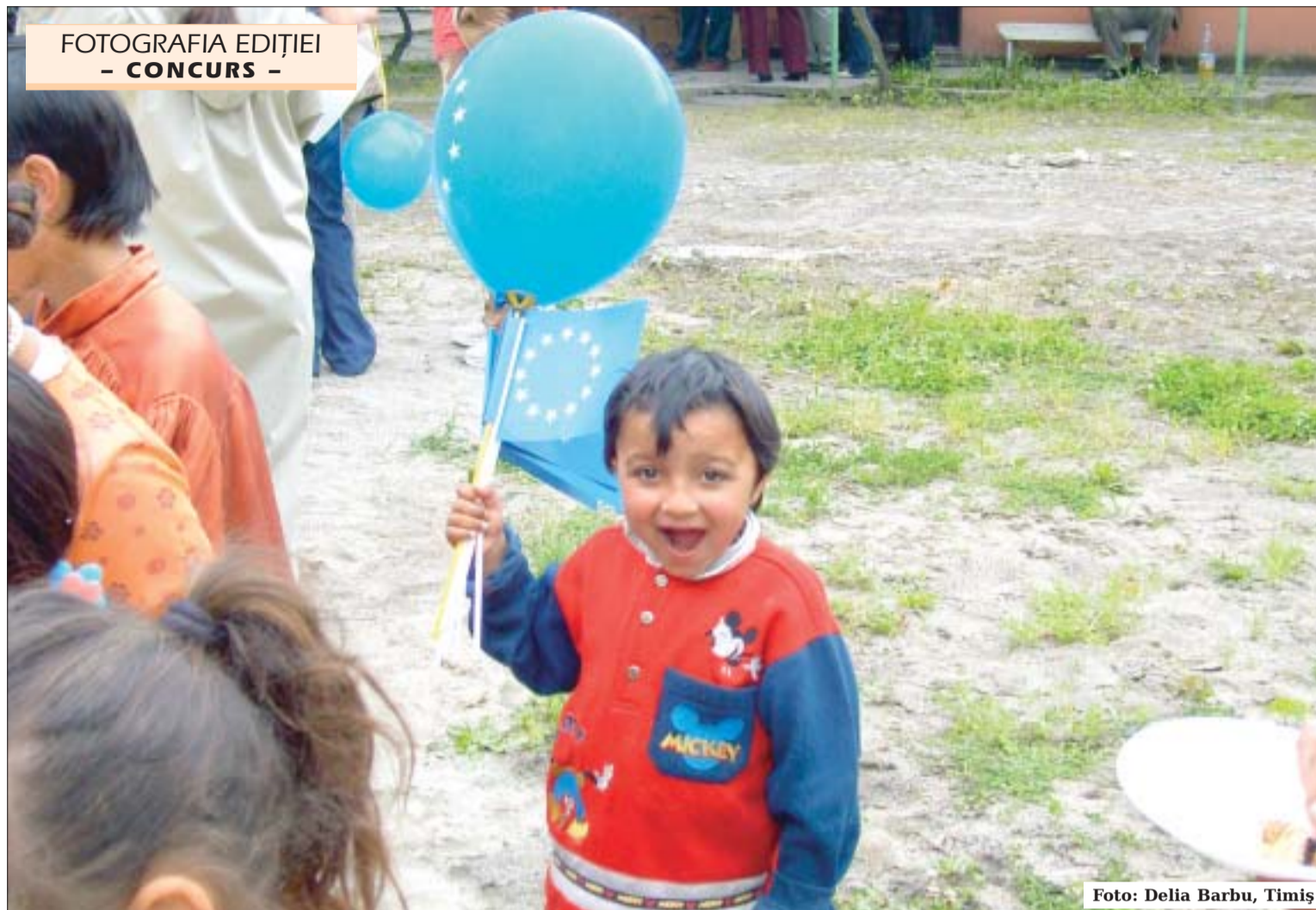
FOTOGRAFIA EDIȚIEI - CONCURS -

■ 07-09 decembrie 2007, Târgoviște – Curs: Fonduri Structurale și de Coeziune 2007-2013: Metodologia de pregătire a dosarului pentru finanțare. Termen-limită de înscriere: 30 noiembrie 2007. În parteneriat cu lanlux Consulting. www.constrain.ro (Cursul organizat la Târgu-Mureș și Târgoviște este structurat pe cei opt pași utilizați de firmele de consultanță din UE în pregătirea proiectelor finanțate din Fonduri Structurale și de Coeziune: Identificarea proiectelor concrete ale organizației, Identificarea Programului Operațional sub care poate fi obținută finanțarea, Verificarea eligibilității beneficiarului și a proiectului, Asigurarea resurselor umane, Asigurarea resurselor financiare (cofinanțare plus „rulaj”), Pregătirea documentației conexe, Completarea „Cererii de finanțare”, Realizarea unei autoevaluări a dosarului sau evaluarea de către un expert/consultant.)